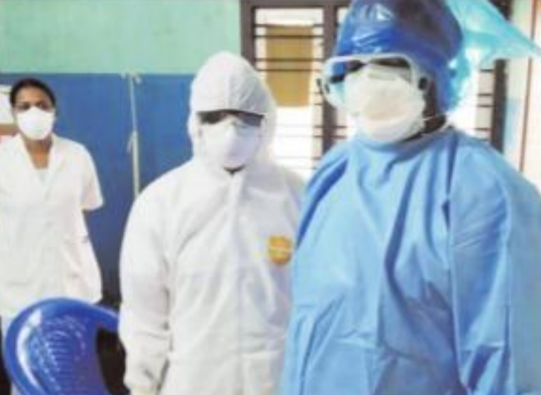
पॉजिटिव आया है। मुख्यमंत्री अरविंद केजरीवाल ने बुधवार को बताया कि खुशी की बात है कि 529 में से केवल 3 पत्रकारों का कोरोना रिजल्ट पॉजिटिव आया है। जिन पत्रकारों का रिजल्ट पॉजिटिव आया है, उनके जल्दी ठीक होने की कामना है। 526 पत्रकारों का कोरोना रिजल्ट निगेटिव आया है। स्वास्थ्य मंत्री सतेंद्र जैन ने कहा कि दिल्ली में कोरोना के अभी 3314 केस हैं, जिसमें 206 केस कल के हैं और कल 201 रिकवरी भी हुए हैं। अब तक दिल्ली में 1078