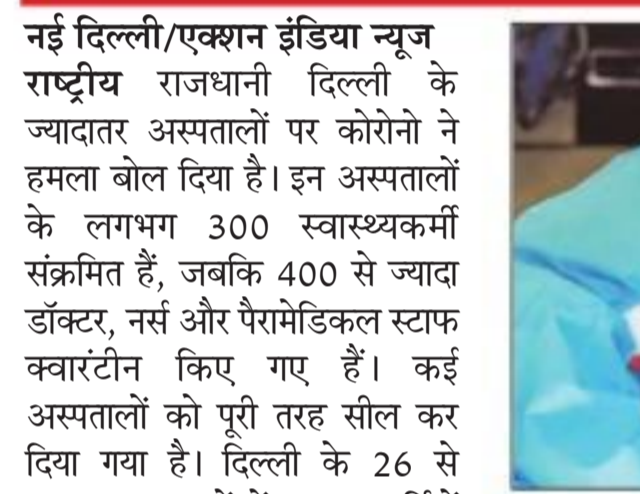
हैं। इनके अलावा दो केंद्र्स एंजुलेस कर्मचारी भी पॉजिटिव हैं, जिन्हें नरेला क्वारंटीन केंद्र में रखा गया है। राजधानी के 4.11 फीसदी स्वास्थ्यकर्मियों संक्रमित: स्वास्थ्य मंत्रालय के अनुसार दिल्ली में 4.11 फीसदी स्वास्थ्यकर्मियों पॉजिटिव हैं। इनमें 33 डॉक्टर, 26 नर्स, 24 फोल्ड वर्कर, 13 पैरामेडिकल कर्मचारी और स्वास्थ्यकर्मियों के परिवार में तीन मरीज हैं। अस्पतालों से मिली जानकारी के अनुसार, आंकड़ा करीब 8 फीसदी हो गया है।

नई दिल्ली/एक्शन इंडिया न्यूज राष्ट्रीय राजधानी दिल्ली के ज्यादातर अस्पतालों पर कोरोना ने हमला बोल दिया है। इन अस्पतालों के लगभग 300 स्वास्थ्यकर्मियों संक्रमित हैं, जबकि 400 से ज्यादा डॉक्टर, नर्स और पैरामेडिकल स्टाफ क्वारंटीन किए गए हैं। कई अस्पतालों को पूरी तरह सील कर दिया गया है। दिल्ली के 26 से ज्यादा अस्पतालों में स्वास्थ्यकर्मियों के संक्रमित होने से केंद्र सरकार की चिंता बढ़ गई है। मुंबई में 300 से अधिक संक्रमित हैं, जबकि यहां भी आंकड़ा लगभग बराबर होने वाला है। कई अस्पतालों के चिकित्सा अधीक्षक तक क्वारंटीन किए गए