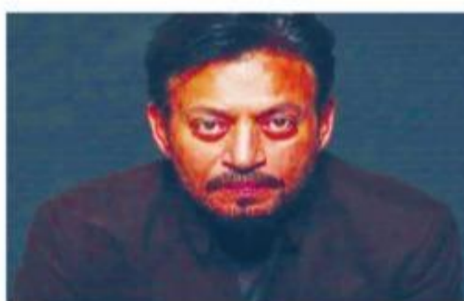
अपने हुनर से हर किसी का दिल जीत लेते थे, भगवान उनकी आत्मा को शांति प्रदान करें टीम इंडिया के मुख्य

बात करते हैं मास्टर ब्लास्टर सचिन तेंदुलकर की, उन्होंने अपने टिवटर पर लिखा है, इरफान खान के निधन की खबर सुनकर दुखी हूँ, वो मेरे पसंदीदा कलाकारों में से एक थे और मैंने उनकी तकरीबन हर फिल्म देखी है, उनकी आखिरी फिल्म अंग्रेजी मीडियम मैंने देखी थी, उनकी एक्टिंग शानदार थी, भगवान उनकी आत्मा को शांति दे, उनके करीबियों के लिए मेरी संवेदनाएं टीम इंडिया के कप्तान विराट कोहली ने भी इरफान खान के निधन पर दुख जताते हुए लिखा है कि, इरफान खान के निधन की खबर सुनकर दुखी हूँ, वो कितने शानदार अभिनेता थे और