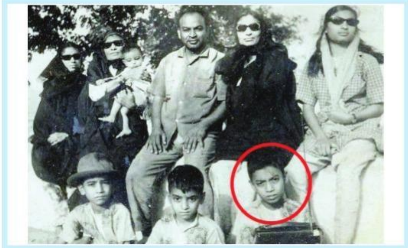
यह इरफान (लाल घेरे में) के बचपन की तस्वीर है। वे अपने परिवार के साथ हैं।

2003 में तिग्मांशु धूलिया के डायरेक्शन में बनी फिल्म 'हासिल' रिलीज हुई। यह फिल्म छात्र राजनीति जैसे विषय पर बनाई गई थी। फिल्म में जिमी शेरगिल, ऋषिता भट्ट, आशुतोष राणा और इरफान खान थे। 'हासिल' सिनेमाघरों में फ्लॉप हो गई लेकिन जब लोगों ने इस फिल्म को सीडी और लैपटॉप में देखा तो बार-बार देखा। फिल्म में इरफान खान का निगेटिव रोल इतना शानदार था कि वह पूरी फिल्म में छा गए। इस फिल्म के लिए इरफान को बेस्ट निगेटिव रोल का फिल्मफेयर अवॉर्ड मिला था। इसके बाद इरफान ने कभी पीछे मुड़कर नहीं देखा।