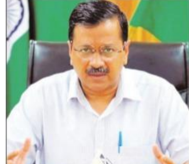
नई दिल्ली/एक्शन इंडिया न्यूज दिल्ली सरकार ने हाल ही में पत्रकारों का कोरोना टेस्ट करवाया था जिसकी रिपोर्ट आ गई है। दिल्ली के 526 पत्रकारों का कोरोना रिजल्ट निगेटिव आया है वहीं केवल 3 पत्रकारों का कोरोना रिजल्ट