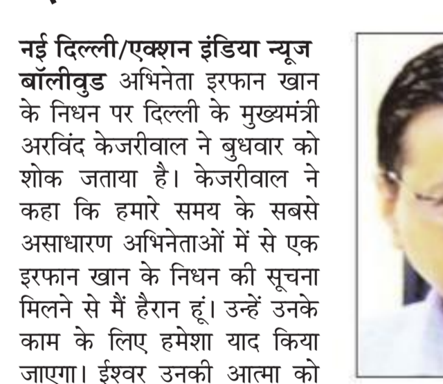
को पता चला था कि वह न्यूरोएंडोक्राइन ट्यूमर से पीड़ित हैं। इस बीमारी के इलाज के लिए इरफान खान लंदन भी गए थे और करीब साल भर इलाज कराने के बाद वहां से स्वदेश लौटे थे। लेकिन मां के इंतकाल के बाद वह बहुत टूट गए थे।

नई दिल्ली/एक्शन इंडिया न्यूज बॉलीवुड अभिनेता इरफान खान के निधन पर दिल्ली के मुख्यमंत्री अरविंद केजरीवाल ने बुधवार को शोक जताया है। केजरीवाल ने कहा कि हमारे समय के सबसे असाधारण अभिनेताओं में से एक इरफान खान के निधन की सूचना मिलने से मैं हैरान हूँ। उन्हें उनके काम के लिए हमेशा याद किया जाएगा। ईश्वर उनकी आत्मा को शांति दे। उल्लेखनीय है कि अभी हाल ही में इरफान खान की मां का निधन हो गया था। वह बेहद सदमे में थे। वर्ष 2018 में इरफान खान