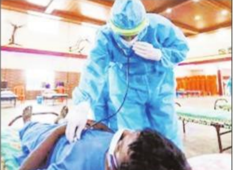
ठीक हुए हैं। 53 आईसीयू में है और 12 वेंटिलेटर पर हैं। उन्होंने कहा कि अब जिन्हें सिम्प्टम नहीं या लाइट सिम्प्टम हैं, वो घर पर ही आइसोलेशन में रह सकते हैं, अस्पताल में आने की जरूरत नहीं है। बाक्स