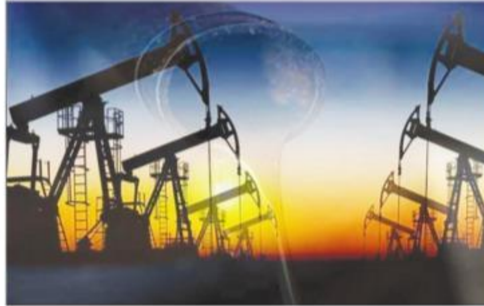
इंडस्ट्री बर्बादी के कगार पर आ गई है। ऑयल प्राइस डॉट कॉम के अनुसार, कीमतें गर्त में जा चुकी हैं और स्टोरेज लगभग फुल हो गया है। ऐसे में कई उत्पादकों

नई दिल्ली: कच्चे तेल की कीमतों में बुधवार को कुछ तेजी देखने को मिल रही है। बुधवार सुबह WTI क्यूड ऑयल और ब्रेंट क्यूड दोनों के ही फ्यूचर भाव में बढ़त देखने को मिल रही है। बुधवार सुबह WTI क्यूड ऑयल का वायदा भाव 11.99 फीसद या 1.50 डॉलर की बढ़त के साथ 13.84 डॉलर प्रति बैरल पर ट्रेड कर रहा था। वहीं, ब्रेंट ऑयल का फ्यूचर भाव बुधवार सुबह 2.81 फीसद या 0.64 डॉलर की बढ़त के साथ 23.37 डॉलर प्रति बैरल पर ट्रेड कर रहा था। कीमतों में भले ही बढ़त देखी जा रही हो, लेकिन यह भाव इंडस्ट्री के हितों को देखते हुए काफी निचले स्तर पर है। खपत में अभूतपूर्व गिरावट और स्टोरेज का संकट होने के कारण लंबे समय से कच्चे तेल की कीमतों में गिरावट आ रही है। हालत यह है कि यूएस ऑयल