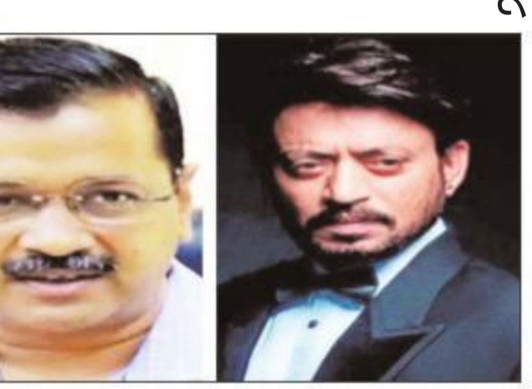
करीब साल भर इलाज कराने के बाद वहां से स्वदेश लौटे थे। लेकिन मां के इंतकाल के बाद वह बहुत टूट गए थे।